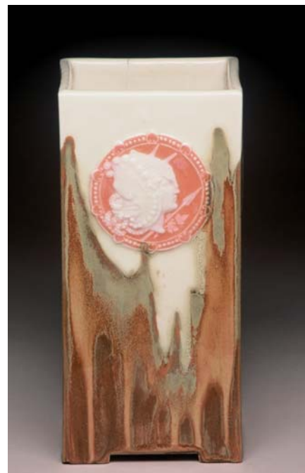
DOAT Taxile, Les Walkyries , 1902, porcelaine blanche, émaux et camées, 23 x 17 cm.