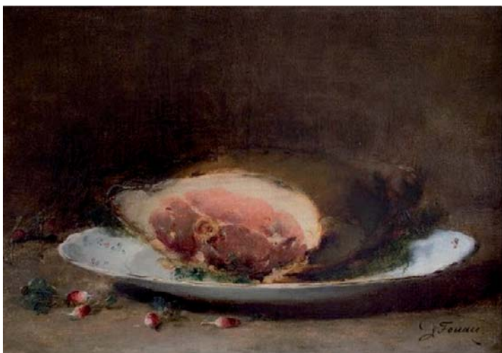
FOUACE Guillaume-Romain, Le Jambon , huile sur toile. Exposé à Boulogne-sur-Mer, 1887, n° 118.