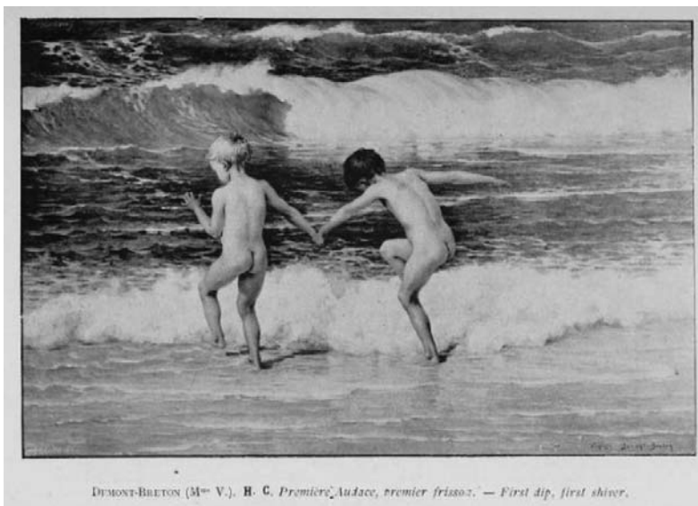
DEMONT-BRETON Virginie, Premier frisson , huile sur toile. Exposé à Paris, 1900, n° 413 ; Boulogne-sur-Mer, 1901, n° 123.

La presse locale est là encore au rendez-vous. De nombreux articles sont édités dans les divers journaux ; mais la plupart ne fournissent qu'une liste des œuvres exposées avec quelques commentaires comme La France du Nord ou Le Cicérone . Le rédacteur du Farceur du 7 septembre 1901 9 évoque l'exposition en ces termes : « Que de beaux, de remarquables portraits, dessinés, peints, que de paysages