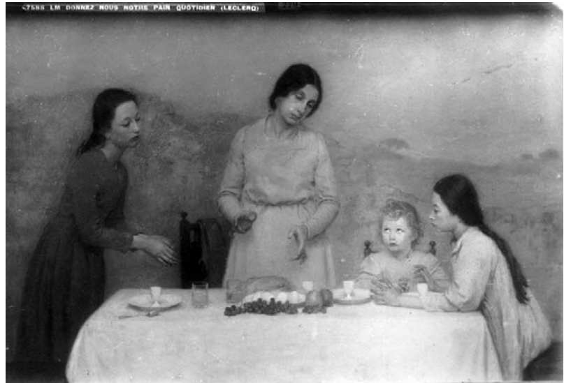
LECLERCQ Louis-Antoine, Donnez-nous notre pain quotidien , 1900, huile sur toile, 122 x 193 cm.

Cette fois-ci, beaucoup plus d'œuvres ont un lien plus ou moins proche avec le Boulonnais notamment : Soir de lune à Boulogne d'André Barbier (n° 20); Portrait du docteur Hamy de