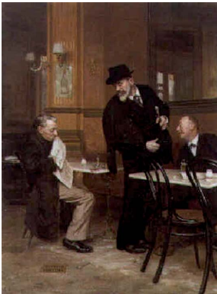
COGGHE Rémy, Caramba ! , 1898, huile sur toile, 100 x 75 cm. Exposé à Paris, 1898, n° 502 ; Anvers, 1898, n° 104 ; Roubaix, 1899, n° 66 ; Tournai, 1900, n° 61 ; Boulogne-sur-Mer, 1901, n° 90.

Contrairement à ce que nous avons pu lire dans le journal La France du Nord du 21 juillet 1887 2 , l'exposition ne se compose pas « de 700 toiles et 128 objets de sculptures, bronze et marbre » mais de « seulement » 310 numéros de « peintures aquarelles, dessins, etc », 6 numéros de « musique, photographie, phototypie, horlogerie,