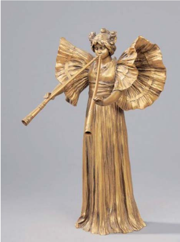
LÉONARD Agathon, Danseuse aux pipeaux , exemplaire en bronze.

Exemplaire identique exposé à Boulogne-sur-Mer, 1901, n° 534.