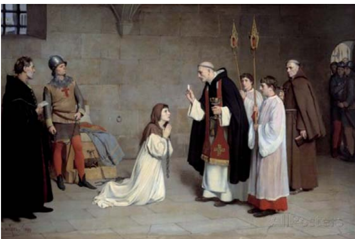
MICHEL Charles-Henri, La Dernière communion de Jeanne d'Arc , 1899, huile sur toile, 164 x 215 cm.

En 1901, est organisée à Boulogne-sur-Mer une autre Exposition Internationale des Beaux-Arts. Créée à l'initiative de René Brisy, –plus connu en tant que rénovateur des Rosati 4 sous le nom de René Le Cholleux–, l'exposition connut un large succès, même si, aucune documentation n'a été conservée.