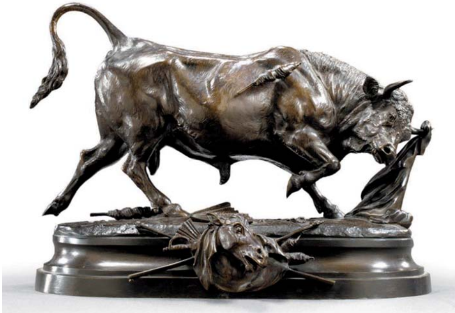
COMOLERA Paul, Taureau de combat , bronze, 29,5 x 40 cm. Exemplaire identique exposé à Boulogne-sur-Mer, 1887, n° 75.