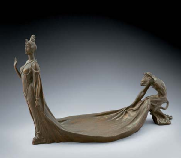
MOREAU-VAUTHIER Paul, Femme au singe , vide-poche, bronze.

Exemplaire identique exposé à Boulogne-sur-Mer, 1901, n° 560.