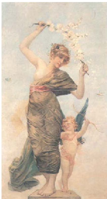
DELACROIX Henry-Eugène, Le Printemps , 1878, huile sur toile, 192 x 108 cm. Exposé à Boulogne-sur-Mer, 1901, n° 109.

L'exposition se déroule du 18 juillet au 15 septembre 1901 5 dans les locaux de la Chambre de Commerce, quai Gambetta. Le but de cette exposition est de « stimuler le goût des arts dans nos provinces comme s'efforcent à l'envie de le faire les États qui nous entourent et en particulier l'Allemagne ».