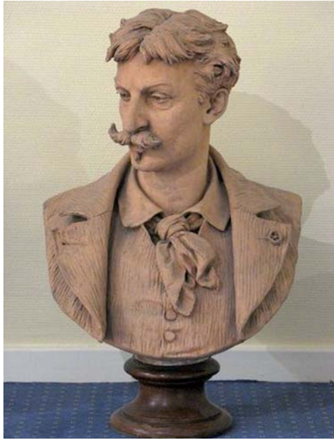
LOUIS-NOEL Hubert, Alphonse de Neuville , plâtre, 70 x 45 x 27 cm. Exemplaire identique exposé à Boulogne-sur-Mer, 1901, n° 537. Saint-Omer, Ecole des Beaux-Arts.