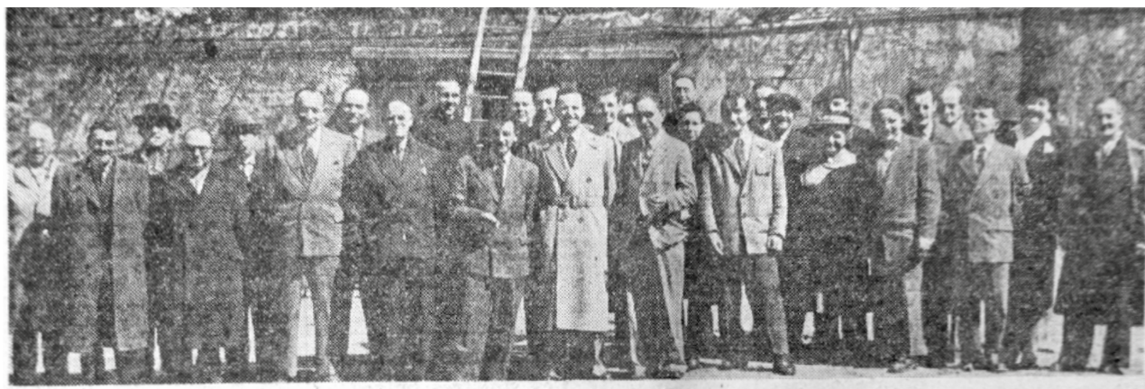
Instantané du 8 mai 1955. Nos imprimeurs sont très nombreux, le photographe a pris le temps de placer tout son monde. Les personnages sont expressifs et laissent paraître sur leur visage souriant l'envie de se retrouver.