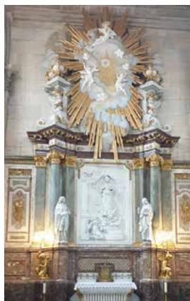
Autel-retable du Sacré-Cœur