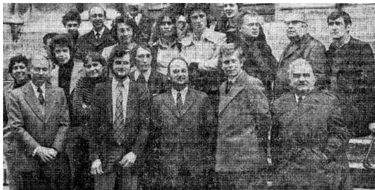
1974 - Boulogne