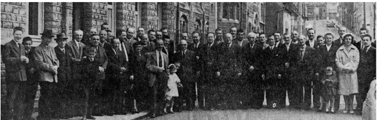
1958 - Boulogne