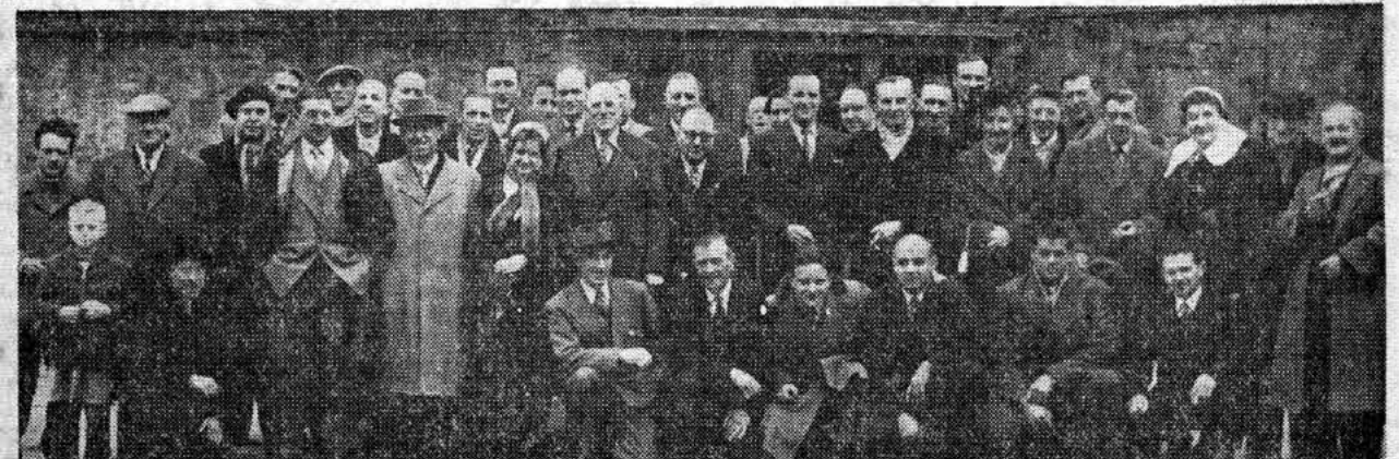
1957 - Photo « La Voix du Nord » - Boulogne

La sortie de la cérémonie sera le point de départ de discussions joyeuses. Ils avancent ensemble dans une ambiance très amicale vers la salle des fêtes. Le vin d'honneur et les réjouissances vont commencer.