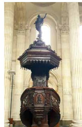
Chaire de vérité