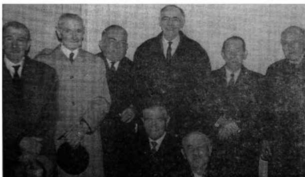
La vieille garde

Sur ce cliché les mines réjouies des imprimeurs qui ont atteint l'âge de la retraite