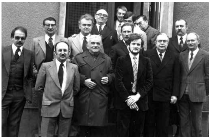
1976 - Boulogne

Le monde change et continue son évolution, le règne de l'imprimerie devra bientôt partager, sous le signe de l'innovation technologique, un autre langage qui est celui du numérique. L'enregistrement des données se fait désormais