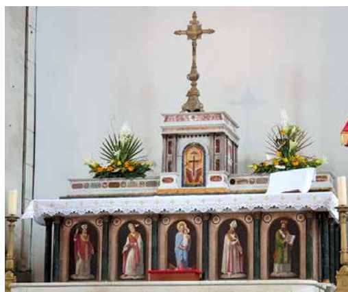
Maître autel Torlonia